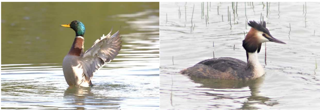
Photos ci-dessus à gauche un Canard colvert et à droite un Grèbe huppé.

Parmi les canards, le plus courant, dans notre région, est bien sûr le Canard colvert, mais il arrive que d'autres espèces de passage, y font une brève halte.