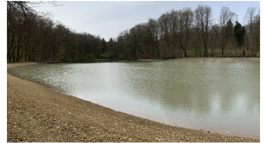
L'étang communal, le Bersigweiher, remis en eau après des travaux de curage