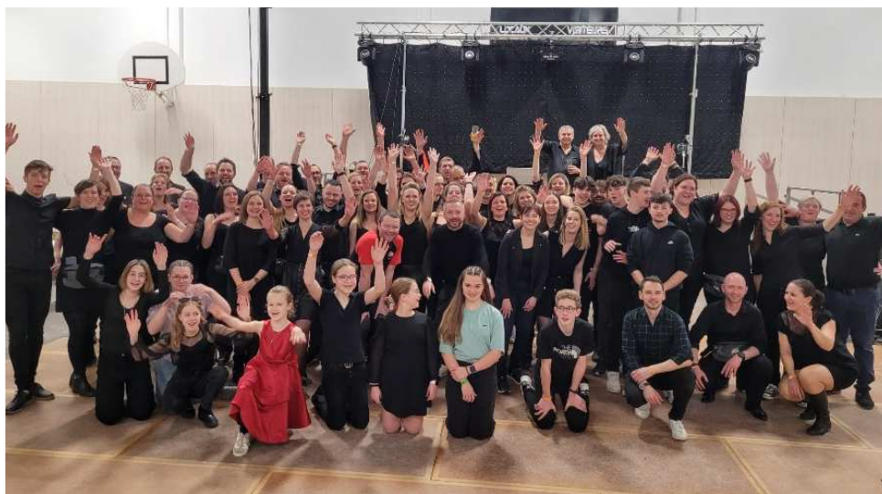
Jura Alsacien Basket (ASH et BCFV) et l'école Primaire Les Abeilles de Heimersdorf (classe de CE1/CE2/CM1/CM2)