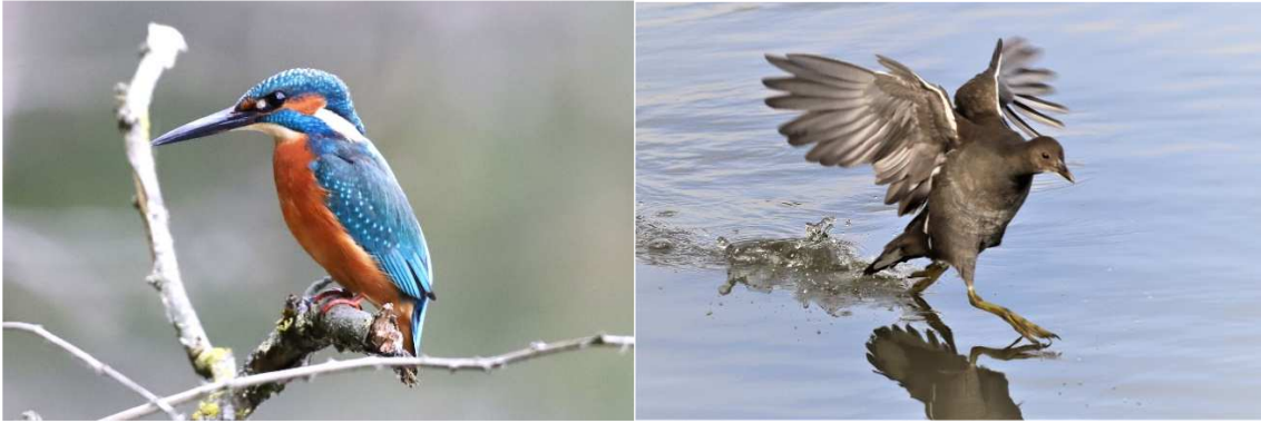
Photos ci-dessus à gauche un Martin pêcheur et à droite une jeune Poule d'eau.

Il ne faut pas oublier que notre région peut être soumise à des températures négatives en hiver. C'est à ce moment-là, lorsque que l'eau est gelée à la surface des étangs que les oiseaux d'eau désertent les lieux. Les endroits privilégiés sont bien sûr les cours d'eau au courant puissant comme par exemple le Rhin.